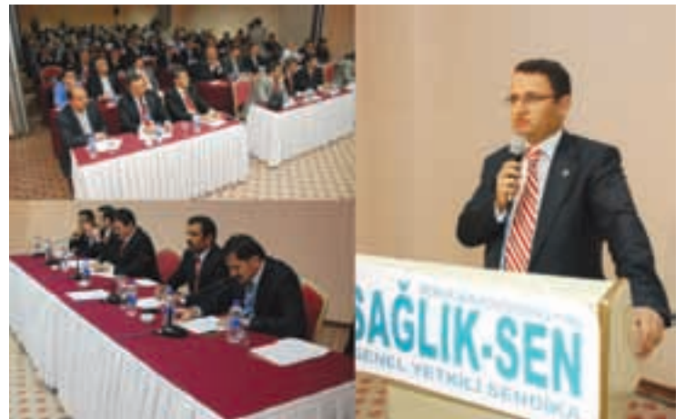
"Yetki Kutlaması" adıyla yapılan program çerçevesinde Sendikamız Başkanlar Kurulu Toplantısı yapıldı.