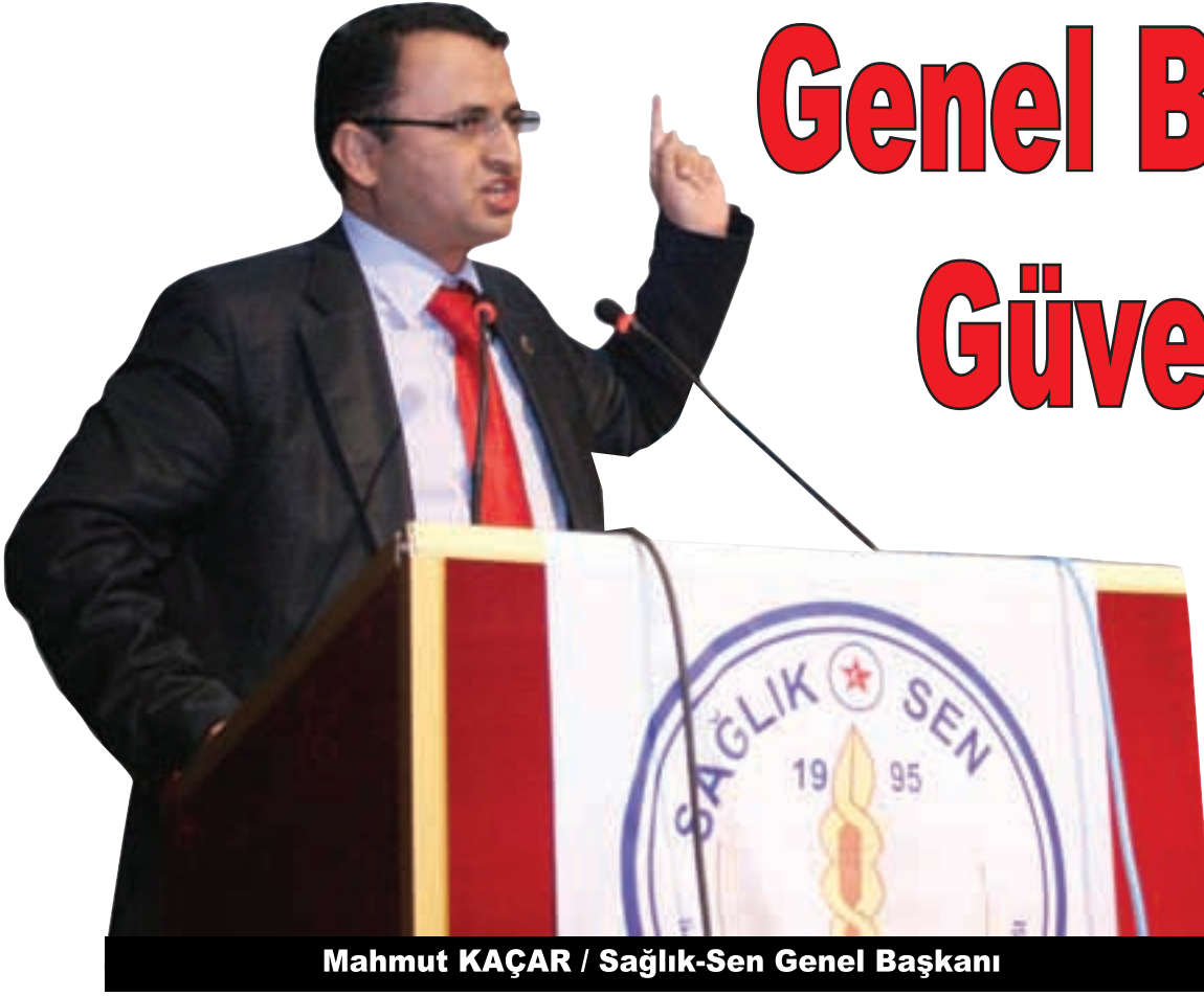
Mahmut KAÇAR / Sağlık-Sen Genel Başkanı