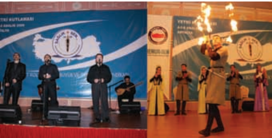
"Yetki Kutlaması" buluşmasında 5 Aralık akşamı teşkilat mensuplarımız kaffas oyunları ve Grup Genç konseri ile yorgunluklarını attı.